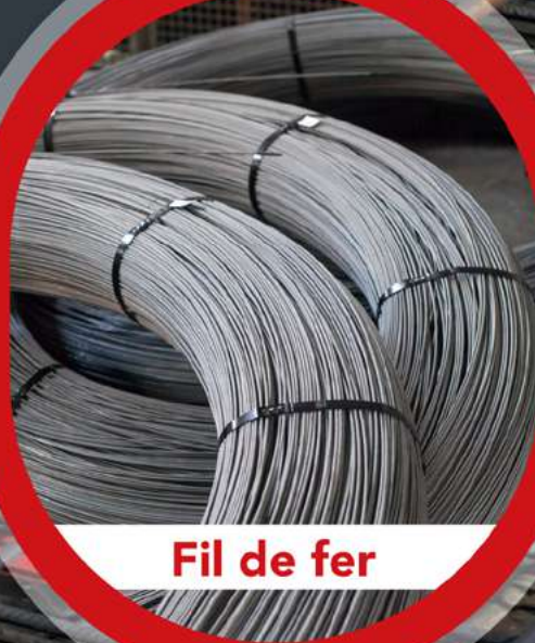
Fil de fer