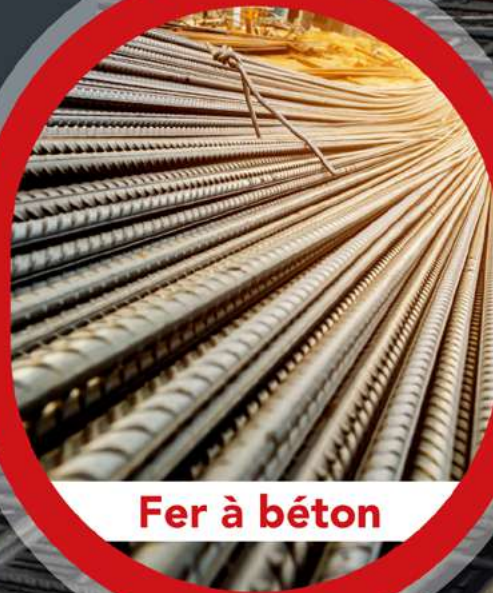
Fer à béton