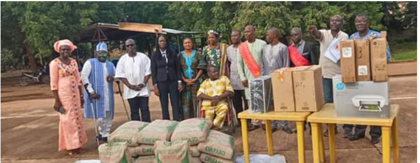
Photo de famille lors de la remise de don au centre national des handicapés moteurs du Burkina